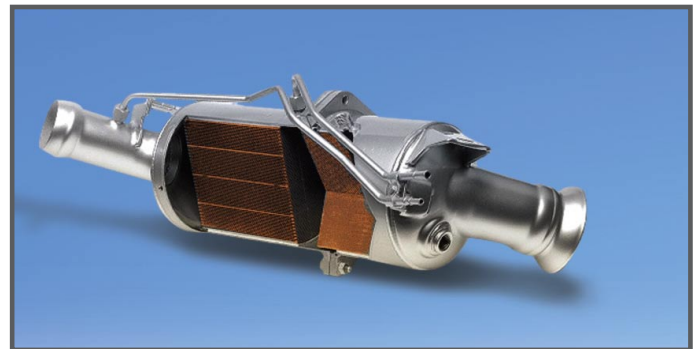
Voor de behandeling met Petromark® DPF Diesel Partikel Filter Reiniger Spray